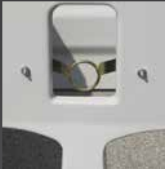
Бампер для морды Используется для ведра с соской