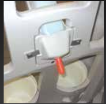
Фиксатор бутылки для быстрой замены