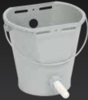
Ведро с соской для кормления