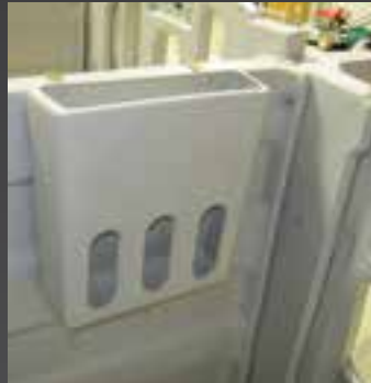
Подвесная пластиковая кормушка для сена